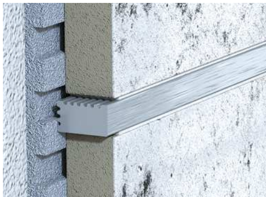
Listela VARIO – elox kartáčovaný

Údržba profilů by měla být prováděna pouze správně naředěnými neagresivními čisticími prostředky, profily by však neměly být dlouhodobě vystaveny působení přípravku. Nezbytností je profil po každé údržbě omýt dostatečným množstvím čisté vody, aby na povrchu nezůstaly zbytky chemikálií. Mezi agresivní čisticí prostředky patří např.: prostředky na odstraňování vodního kamene, čištění odpadů, čištění cementových usazenin, přípravky na odstraňování připečených nečistot ze sporáků apod.