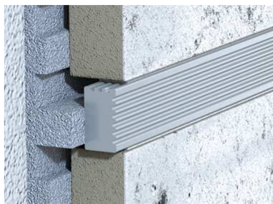
Listela VARIO- elox vroubkovaný