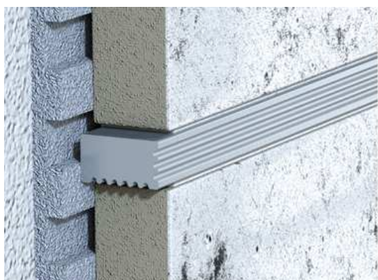
Listela VARIO- elox vroubkovaný