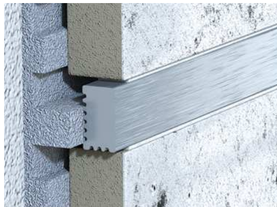
Listela VARIO- elox kartáčovaný