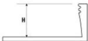
Profil „L“ mosaz masiv